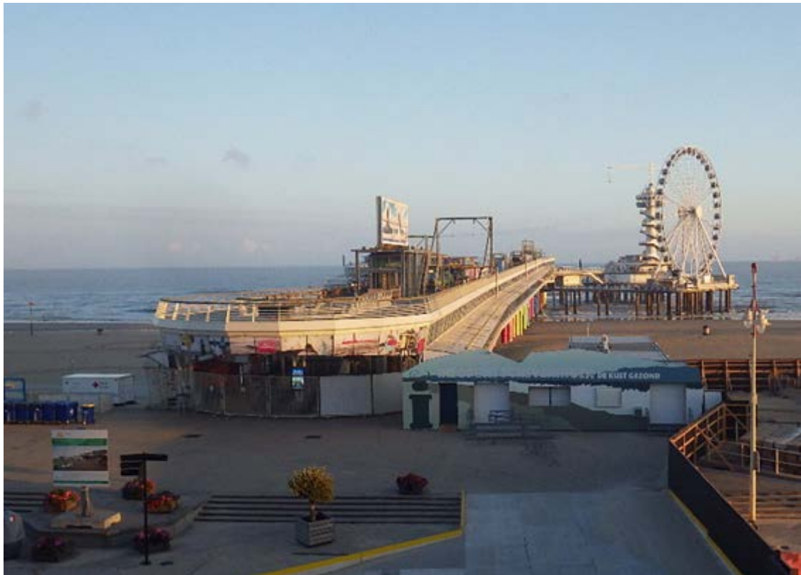
スヘフェニンゲン栈橋